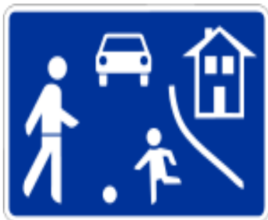
( Zeichen 325 )

Der Rathausplatz und die Heerstraße (Teilbereich von der Tiefgarage Marienburg bis zur Fußgängerzone), Hellenstraße (Teilbereich der Durchfahrt von der Krummgasse zur d´Esterstraße) sowie die Gemeindestraße „Gilgenborn“, sind als verkehrsberuhigter Bereich ausgewiesen.