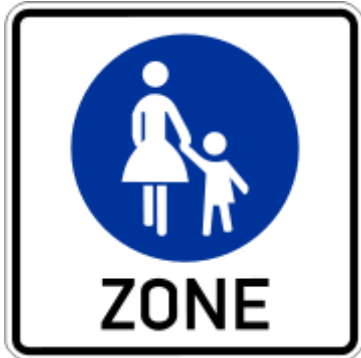
( Zeichen 242 )

Die Hellenstraße und die nördliche Heerstraße sowie der Burgplatz sind als Fußgängerzone ausgewiesen.